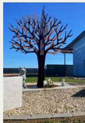
Lebring – beim Seelenbaum