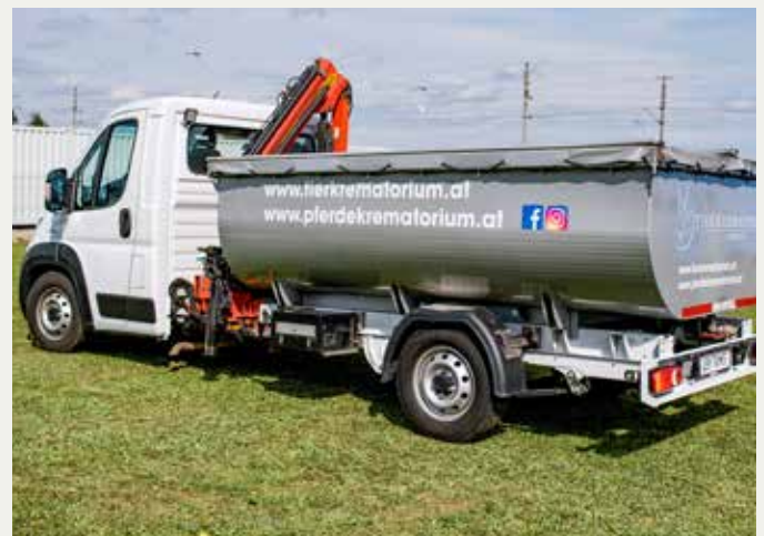
Unser Fahrzeug zur Großtierabholung

Das Tierkrematorium Lebring distanziert sich in jeder Hinsicht von Sammeleinäscherungen und steht die Pietät gegenüber dem verstorbenen Tier stets im Vordergrund.