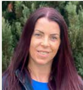
Claudia Hammer Büro Lebring