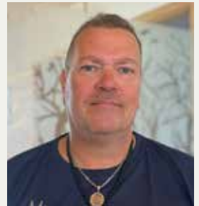
Niklas Huber Büro Elsbethen/ Salzburg