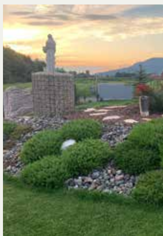
Lebring – am Gelände des Tierkrematorium Lebring