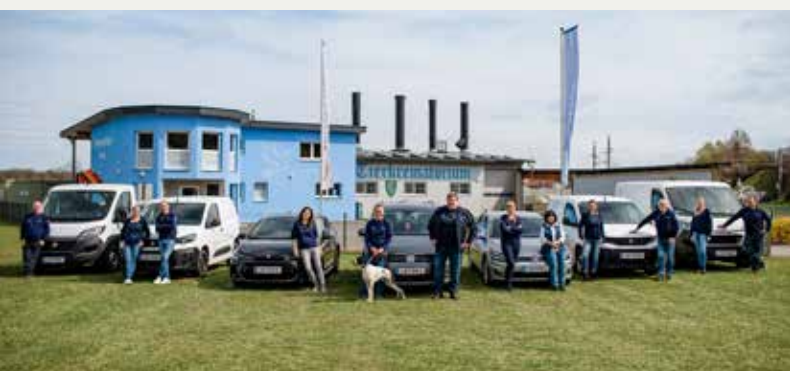
Unsere Fahrzeuge zur Tierabholung

Die Kosten der Kremierung richten sich nach dem Gewicht des verstorbenen Tieres. Dieses wird nach Einlagen bei uns sorgfältig mittels einer geeichten Waage verwogen und dann der passenden Gewichts-/Preiskategorie zugeteilt. Für Kleintiere und Katzen verrechnen wir eine Kremierungspauschale, welche unabhängig von dem Gewicht des Tieres ist. Da die Abholpreise und Kosten für Urnen/Andenkenschmuck individuell sind, sind diese in den Preisen nicht inbegriffen. Sämtliche Preise finden Sie auf unseren Websites www.tierkrematorium.at und www.pferdekrematorium.at