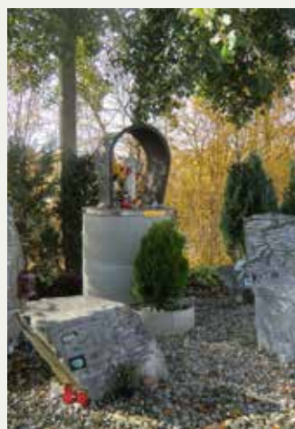
Graz – nächst dem Tierheim Arche Noah