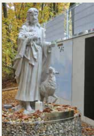
St. Josef – beim Franziskus Urnenhain im Schilcherland

Einbringen der Asche in die Sammelgruft inkl. Bild/Name des Tieres auf einem Gedenkstein bzw. einem Blatt am Seelenbaum